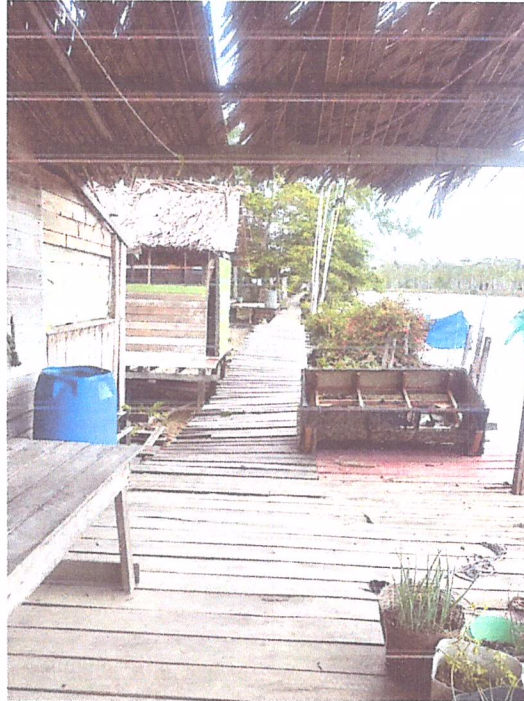
Imagem 07- Vista do trecho 5 da passarela.