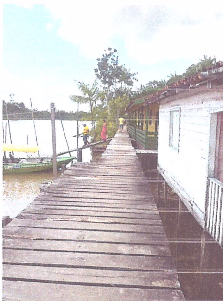
Imagem 01- Vista do trecho 2 da passarela.