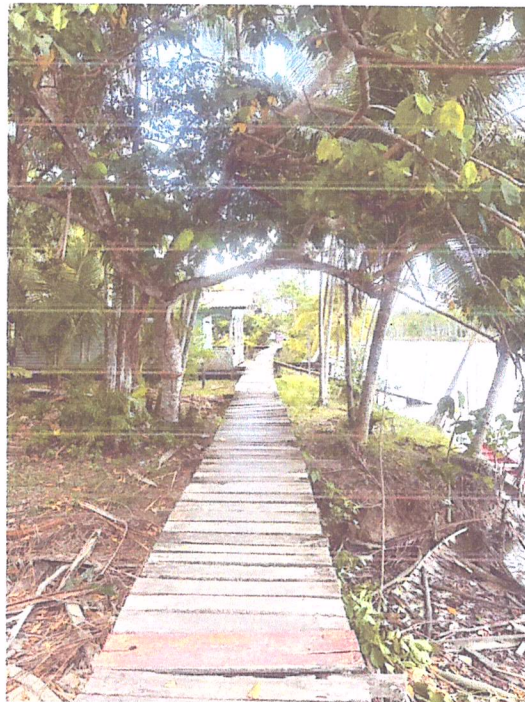
Imagem 04- Vista do trecho 3 da passarela.