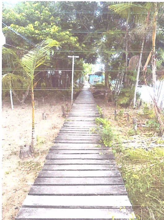
Imagem 09- Vista do trecho 3 da passarela