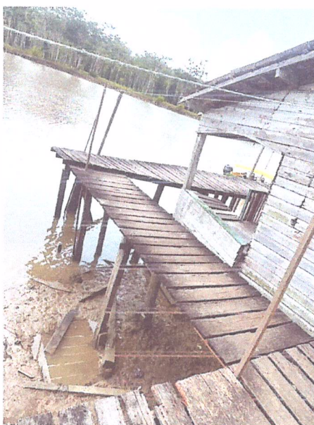
Imagem 02- Vista do trecho 1 da passarela.