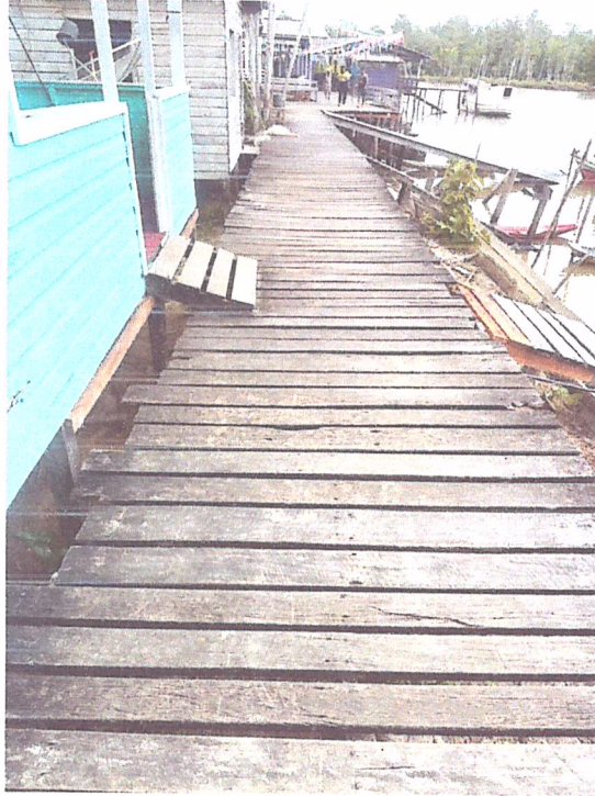
Imagem 03- Vista do trecho 1 da passarela.