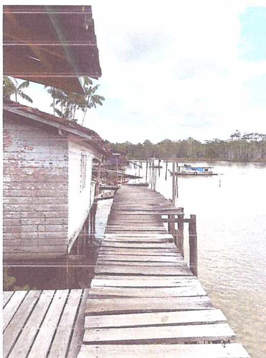
Imagem 10- Vista do trecho 3 da passarela.