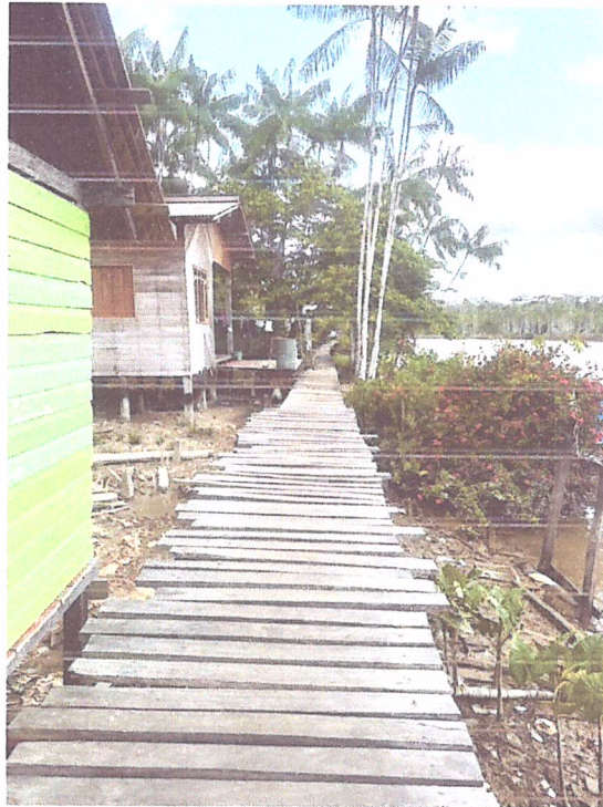
Imagem 05- Vista do trecho 4 da passarela.