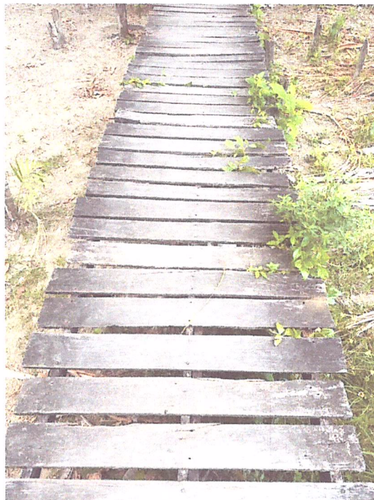
Imagem 08- Detalhe do piso deteriorado.