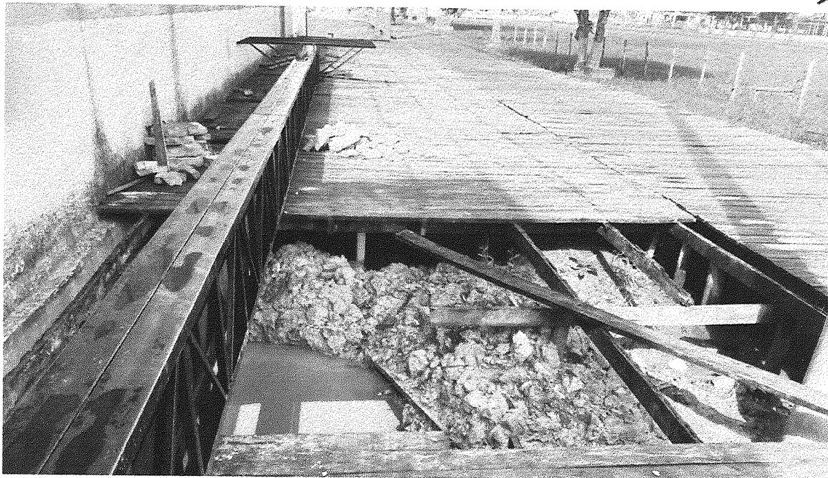
Imagem 03 – Tablado em madeira em frente ao estádio.