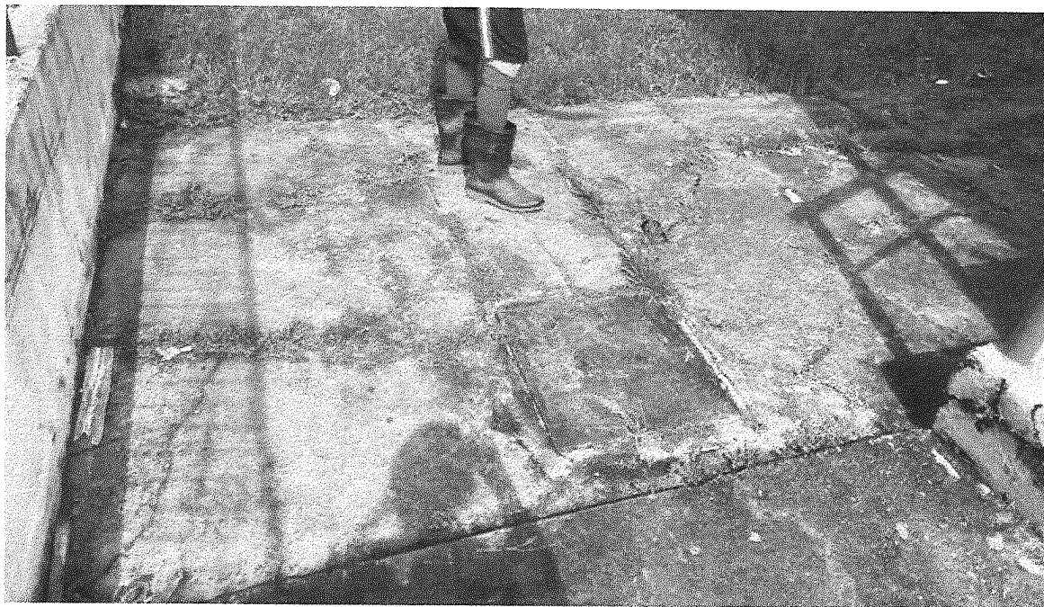
Imagem 11 – CALÇADA DE ACESSO AOS BANHEIROS E VESTIÁRIOS.