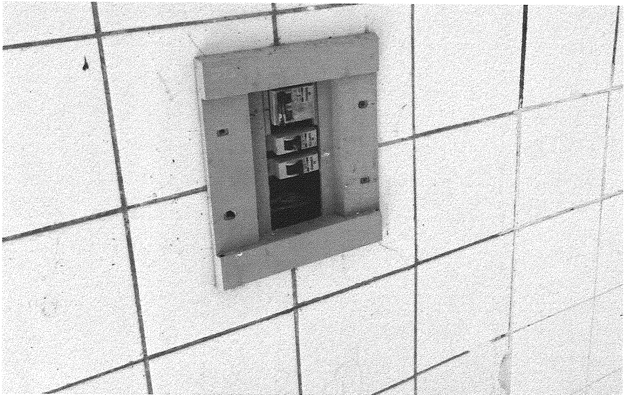
Imagem 10 – Caixa de força.