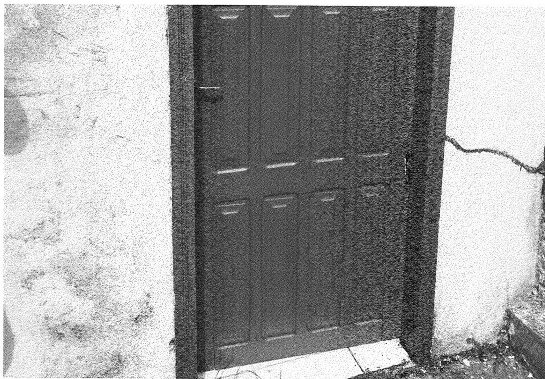
Imagem 08 – Porta de acesso ao vestiário degradada por cupim.