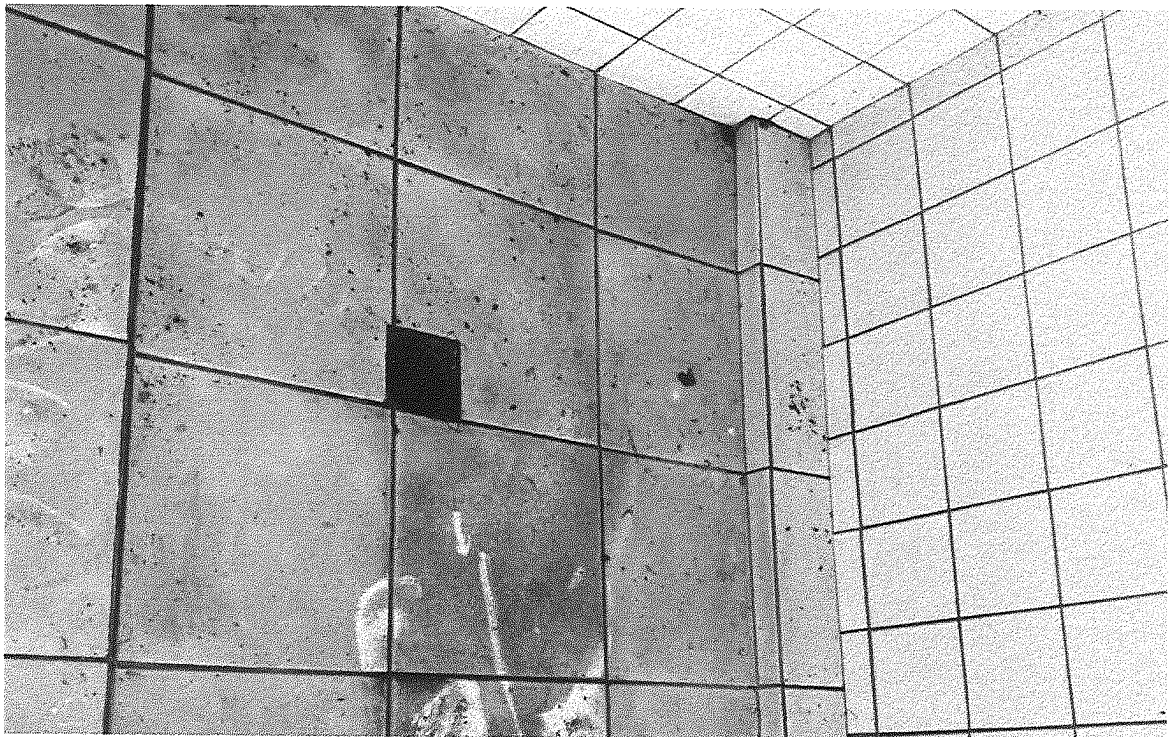
Imagem 06 – Banheiro do estádio faltando ralo.