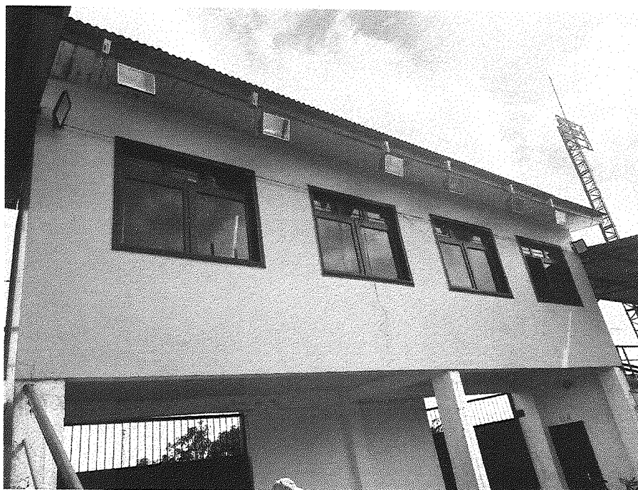
Imagem 01 – Cabine de transmissão.