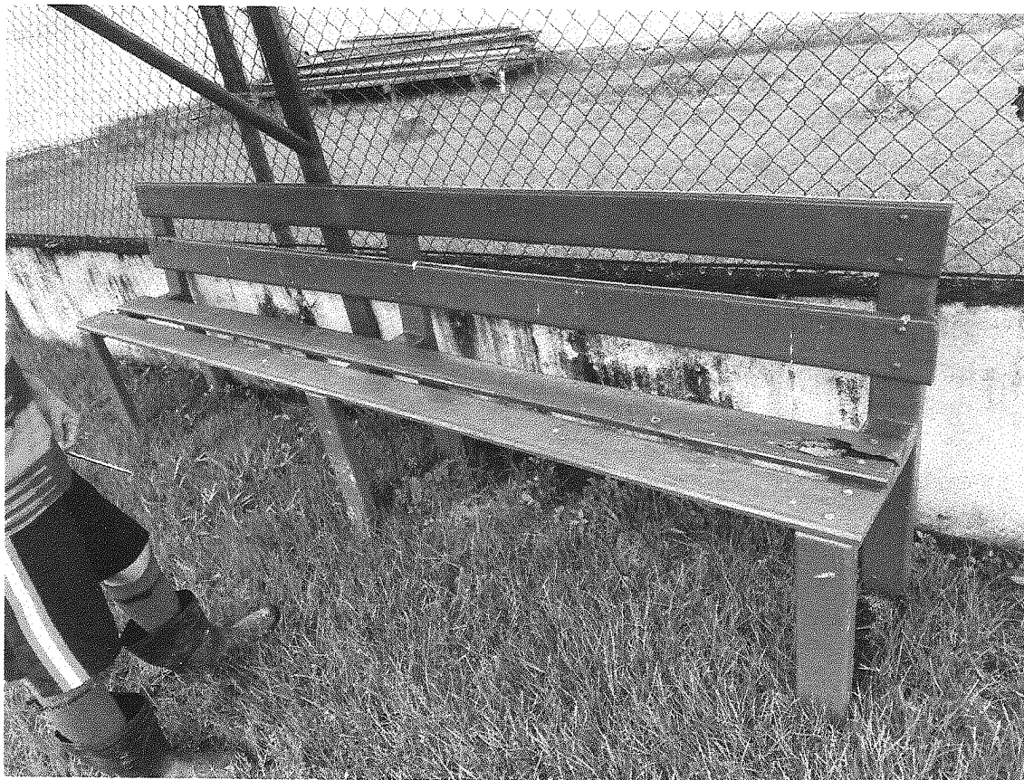
Imagem 04 – Banco de reservas.