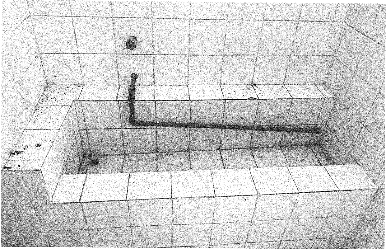
Imagem 09 – Mictório do estádio.