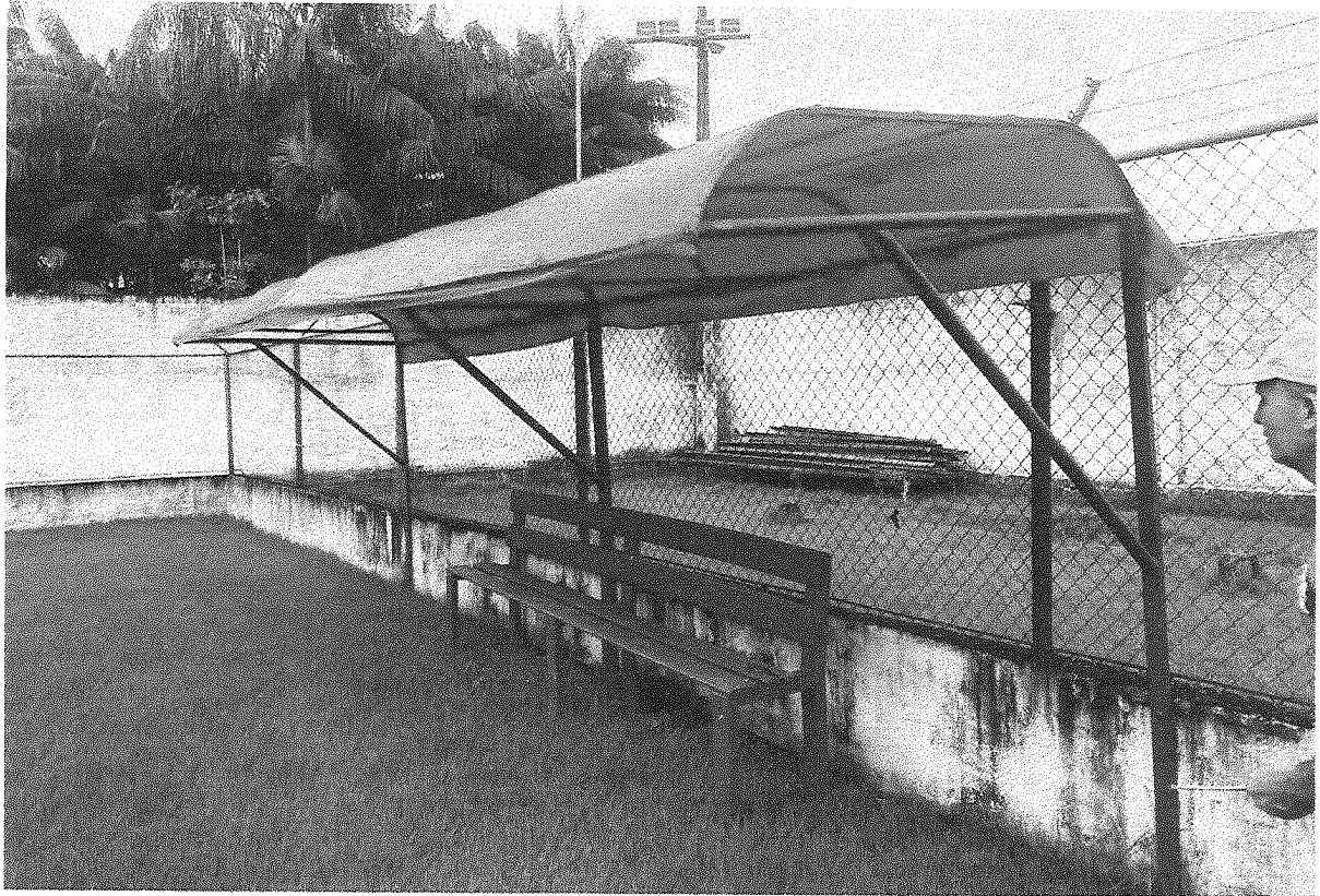
Imagem 05 – Banco de reservas.