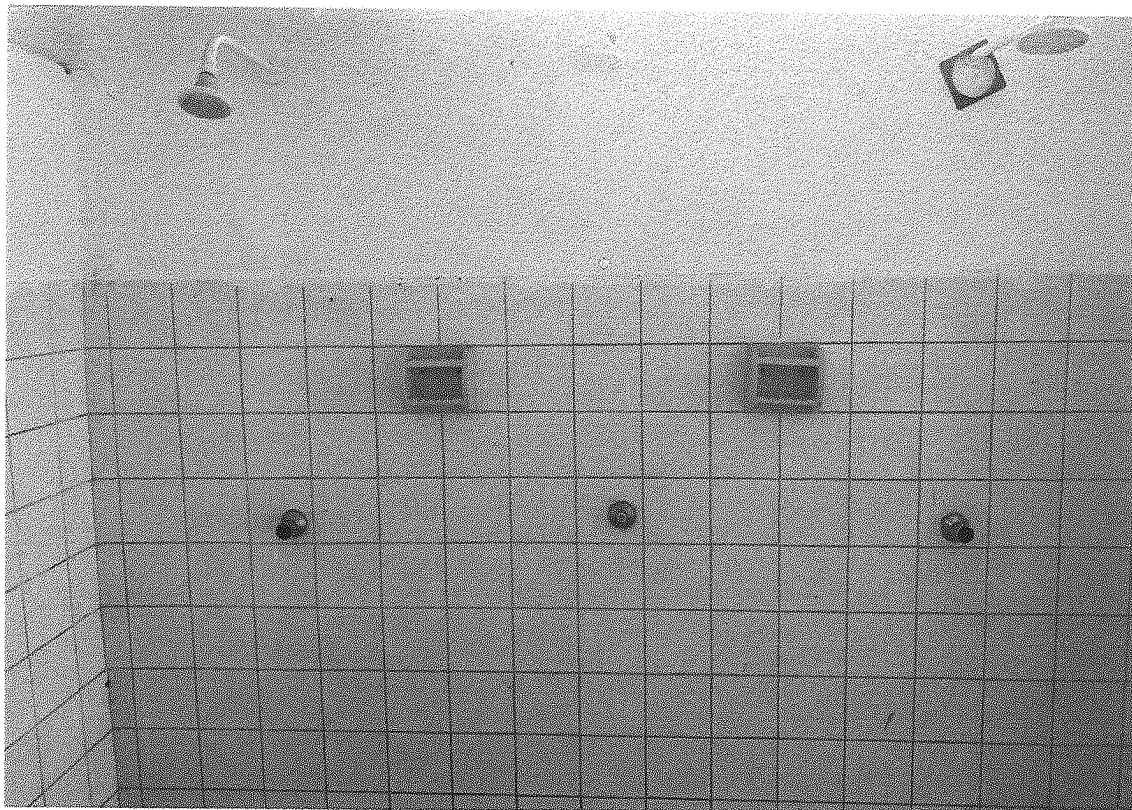
Imagem 07 – Banheiro do estádio com registro do chuveiro quebrado.