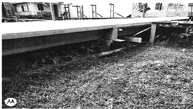
IMAGEM MERAMENTE ILUSTRATIVO

TÍTULO: CONSTRUÇÃO DE PASSARELA EM CONCRETO ARMADO DAS RUAS ABÍLIO MÁXIMO, RUA MANOEL FLORINDO E RUA ITUÍ, NO BAIRRO CENTRO